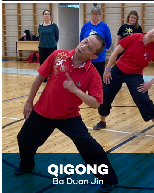
QIGONG Ba Duan Jin