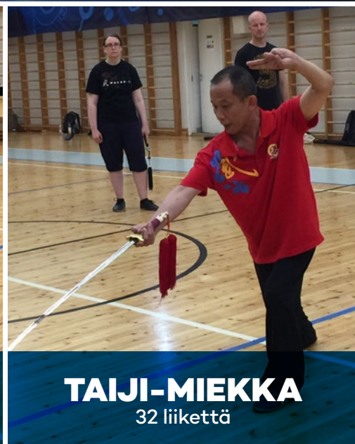
TAIJI-MIEKKA 32 liikettä