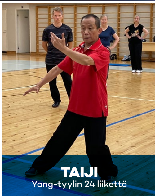
TAIJI Yang-tyylin 24 liikettä